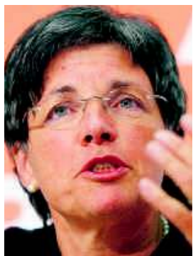
Personenschutz für CVP-Nationalrätin Lucrezia Meier-Schatz.

Bundesrat Blocher hat den Rückhalt in der Bevölkerung nicht verloren. Eine Umfrage zeigt, dass nur ein Viertel der Befragten seinen Rücktritt will. Nationalrätin Lucrezia Meier-Schatz steht nach massiven Drohungen unter Polizeischutz.