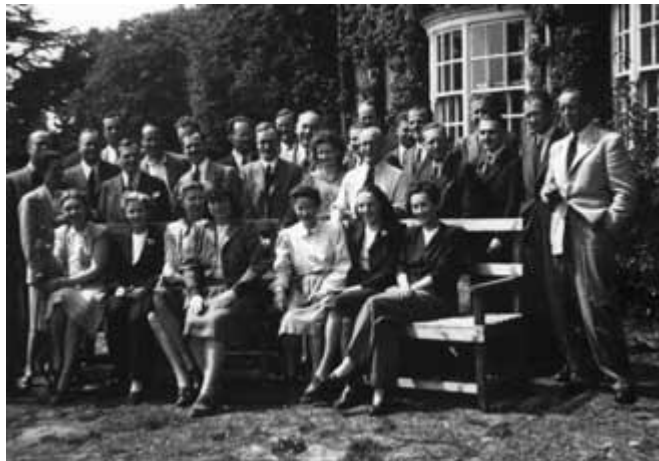
(Gründung 1947, Quelle: Gallup International)